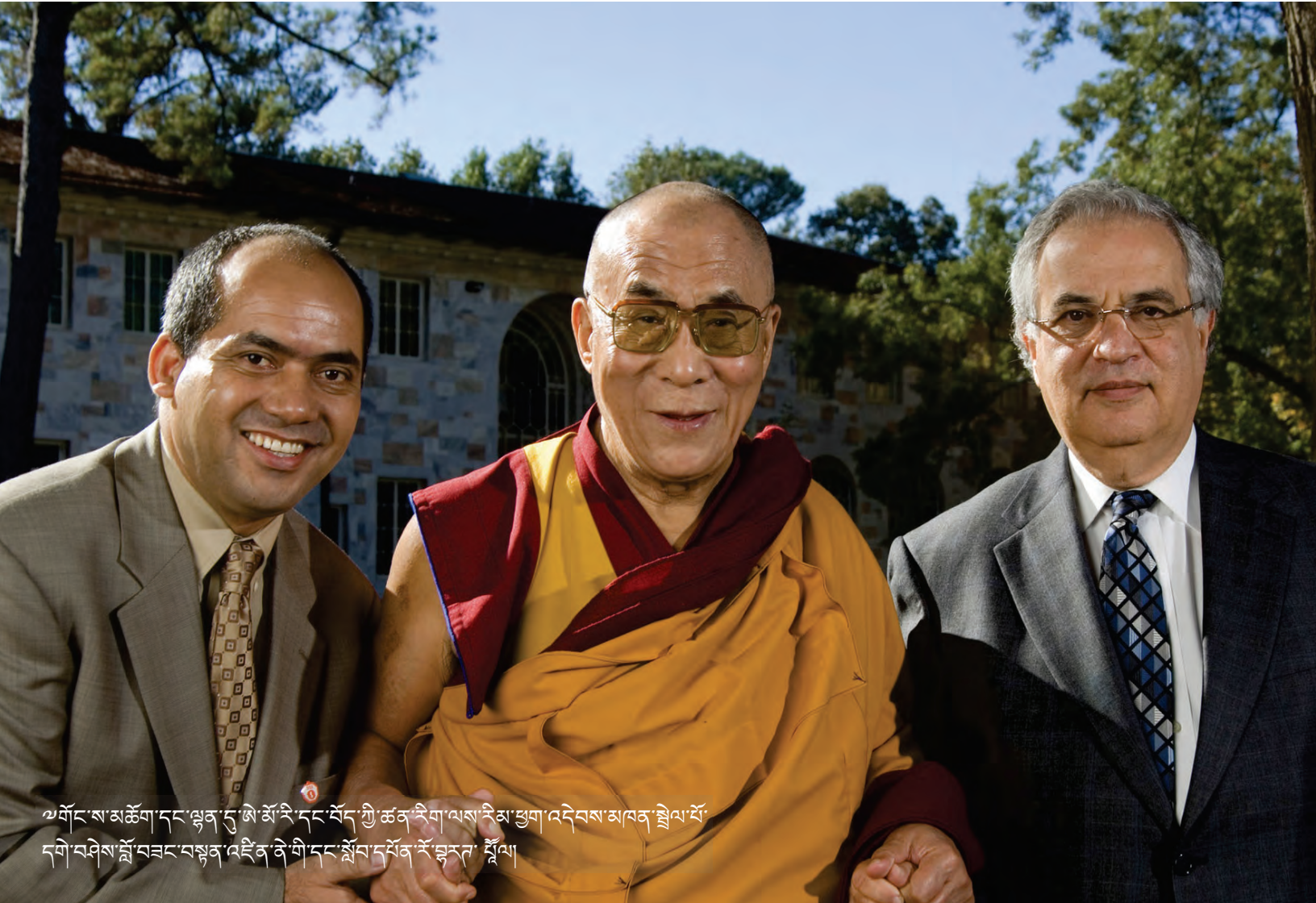
ཡལོང་ས་མཚོག་དང་ལྷན་དུ་ཨ་མོ་རི་དང་བོད་ཀྱི་ཚན་རིག་ལས་རིམ་ཕྱག་འདེབས་མཁན་རྒྱེལ་པོ་ དགེ་བཤེས་སློབ་བཟང་བསྟན་འཛིན་ལེ་གི་དང་སློབ་དཔོན་རོ་གླུ་ཏེ་སྟོན།