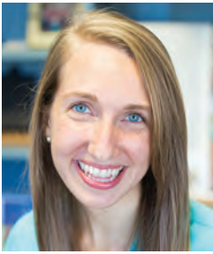
ཁེ་ལེ་མེ་ལྷོ་རྩེད།

ཨ་མོ་རི་གཙུག་ལག་སློབ་གཉེན་ཁང་དུ་ལོ་རྒྱུ་ ༡༠ རིང་གི་ཁོང་གིས་གཞི་ རིམ་གྱི་ཚན་རིག་དང་། ཚན་རིག་དང་ཚོས་ལུགས། ཚན་རིག་གི་ཤེས་ཡོན། སྐུ་དངོས་རིག་པའི་བཟང་སྤྱོད་ལག་ལེན་བཅས་ཀྱི་ནང་མཁས་པའི་བྱ་བ་ བརྒྱབས་ཡོད་ཅིང་། ཨ་མོ་རི་ཉེ་བའི་གཙུག་ལག་སློབ་གཉེན་བ་དང་། གཙུག་ ལག་སློབ་གཉེན་བ། འབྲུམ་རམས་གསར་མ་བ། ཚན་ཁག་འདྲ་མིན་གྱི་ཆེད་ ལས་པ་དུ་མར་སློབ་ཁྲིད་གནང་གི་ཡོད། ཁོང་གི་ཨ་མོ་རི་དང་བོད་ཀྱི་ཚན་ རིག་ལས་རིམ་ཐོག་མར་འདུགས་མཁུག་གི་གས་ཡིན་ལ། ཨ་མོ་རི་དང་བོད་ཀྱི་ ཚན་རིག་ལས་རིམ་གྱི་ཆེ་སློབ་ཚན་རིག་དུ་ཁག་གི་འགོ་ཁྲིད་ཀྱང་ཡིན།