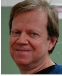
ཏེ་མེ་ཏེན་ཏེན་མོན།

ཁེ་ལེ་མེ་ལྷོ་རྩེད་ལགས་ཀྱིས་ཨོ་ཏུ་ཡོ་མངའ་སྡེའི་ གཙུག་ལག་སློབ་གཉེན་ཁང་དུ་སྐུ་དངོས་སྐྱོན་ སློབ་ཚན་རིག་དང་ལྷ་སྐབ་སློབ་སྤྱོད་གནང་། རབ་འབྲུམས་པའི་སྐབས་སུ་པགས་པའི་འབྲས་ ནང་གི་རིགས་རྗེས་རིག་པ་སློབ་སྤྱོད་བྱས་པའི་ ཉམས་སྤོང་གི་ལུགས་རྒྱུན་ལ་བརྟེན་ནས་ཁ་རོ་ ལི་ན་བྱང་མའི་གཙུག་ལག་སློབ་གཉེན་ཁང་དུ་ རིགས་རྗེས་དང་འདུས་རྒྱལ་སྐུ་དངོས་རིག་པའི་ཐད་དུ་འབྲུམ་རམས་པ་ཐོན། འབྲུམ་རམས་པའི་དམ་བཅའ་མ་གྲུབ་པའི་བདུན་ཕྱག་གཅིག་གི་སློན་སྐྱེ་ལོ་ ༡༠༡༢ ལོའི་ཕྱི་ཟླ་ ༡༡ པའི་ནང་ཨ་མོ་རི་གཙུག་ལག་སློབ་གཉེན་ཁང་གི་ཨ་ མོ་རི་དང་བོད་ཀྱི་ཚན་རིག་ལས་རིམ་དུ་འབྲུམ་རམས་རྗེས་ཀྱི་ཞིབ་འཇུག་གི་ ལས་གནས་ཐོབ། ཁོང་གིས་བོད་ཀྱི་བྱ་བཅུན་གྱིས་དེང་རབས་ཚན་རིག་སྤྱངས་ བཞིན་པའི་འོས་བབས་རང་བཞིན་དང་། ཁོང་ཚོས་ཚན་རིག་སྤྱངས་བཞིན་པའི་ སྐབས་ཀྱི་བསམ་སློབ་འཁྱེར་སོ་སོགས་ལ་ཞིབ་འཇུག་བྱས། ཕྱི་ལོ་ ༡༠༡༧ ལོའི་ ཕྱི་ཟླ་ ༧ པའི་ནང་ནང་ཁོ་མོར་རྒྱལ་སྤྱི་འཕེལ་གྱི་དུ་ཡི་ཤེས་ཡོན་དང་ཆེད་ལས་ ཀྱི་དམིགས་བསལ་སློབ་གཉེན་པའི་ཆེ་མཐོངས་ཐོབ་སྟེ་འབྲས་སྤྱངས་སློབ་གསལ་ སྤྱིང་སློབ་སྐབས་དང་ཚན་རིག་སྟེ་གནས་ཁང་དུ་བྱ་བཅུན་གྱིས་ཚན་རིག་སྤྱངས་ བཞིན་པར་ཞིབ་འཇུག་བྱེད་པའི་ཐབས་ལམ་གསར་སྐྱོན་བྱེད་བཞིན་སྐུ་དངོས་ ཚན་རིག་སློབ་ཁྲིད་གནང་བཞིན་ཡོད།