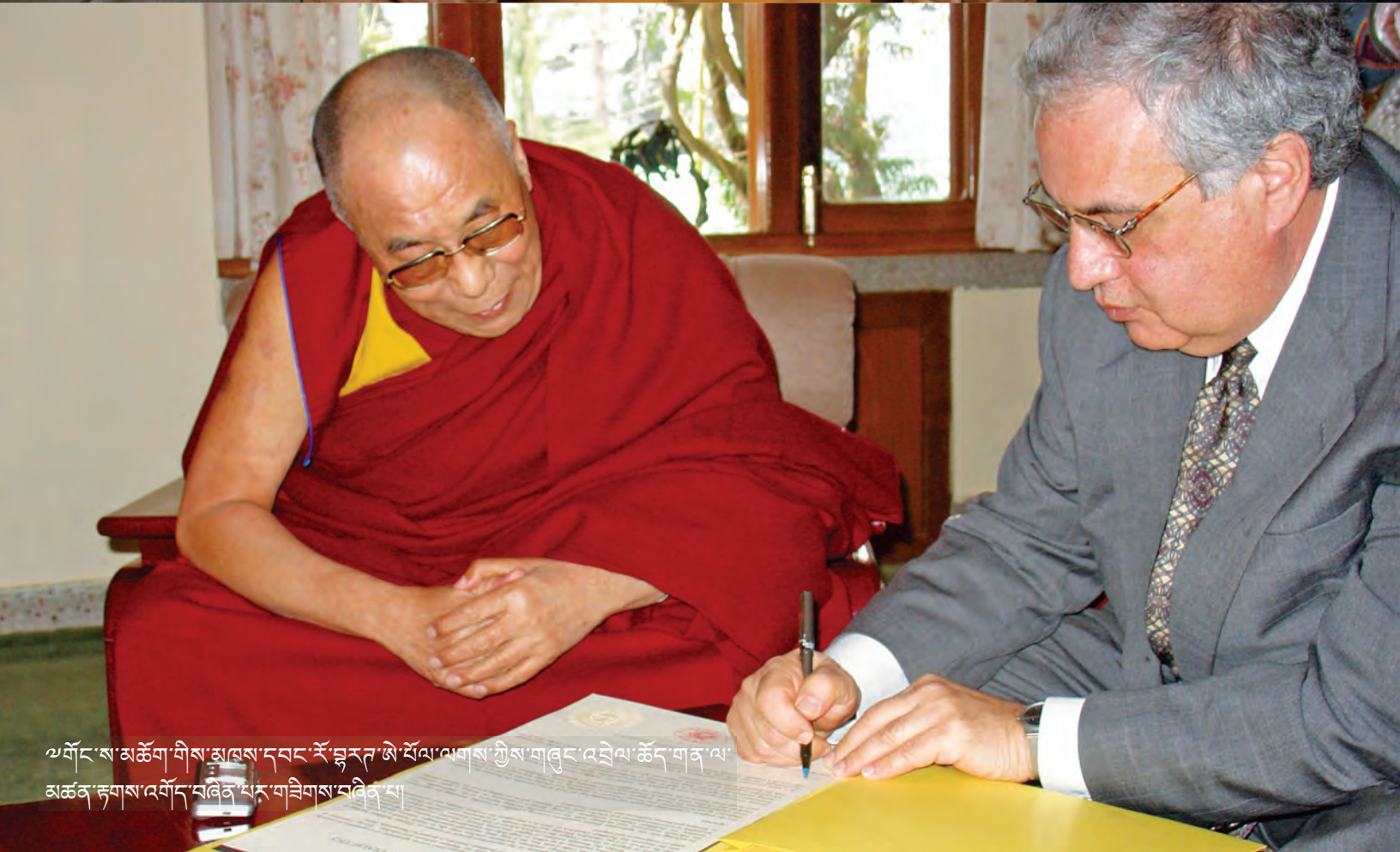
ཡལོང་ས་མཚོག་གིས་ལུས་དབང་རོ་གླུ་ཏེ་པོལ་ལགས་ཀྱིས་གཞུང་འབྲེལ་ཚོད་གན་ལ་ མཚན་ཉག་ས་འགོད་བཞིན་པར་གཟིགས་བཞིན་གྱི།