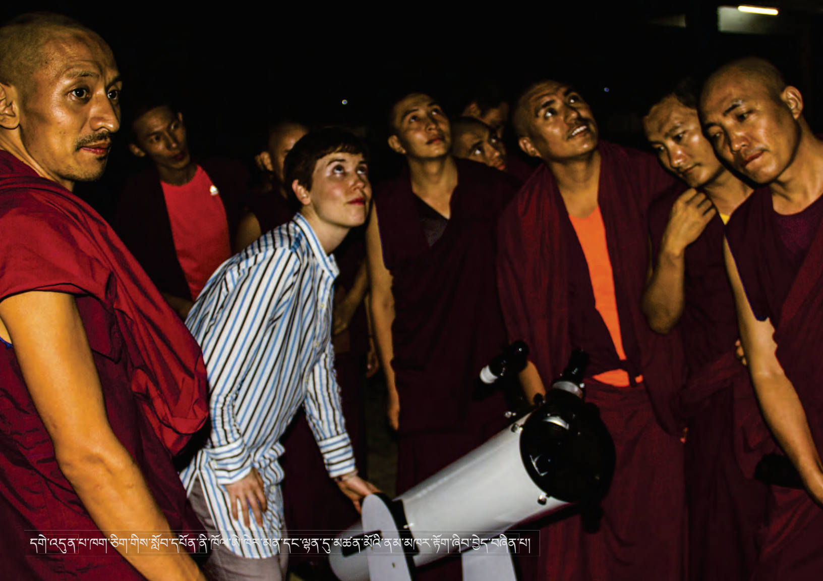
དགེ་འདུན་པ་ལག་ཅིག་གིས་སློབ་དཔོན་ནི་ཁོལ་ལ་ལེན་མན་དང་ལྷན་དུ་མཚན་མོའི་ནམ་མཁམས་རྟོག་ཞིབ་བྱེད་བཞིན་པ།