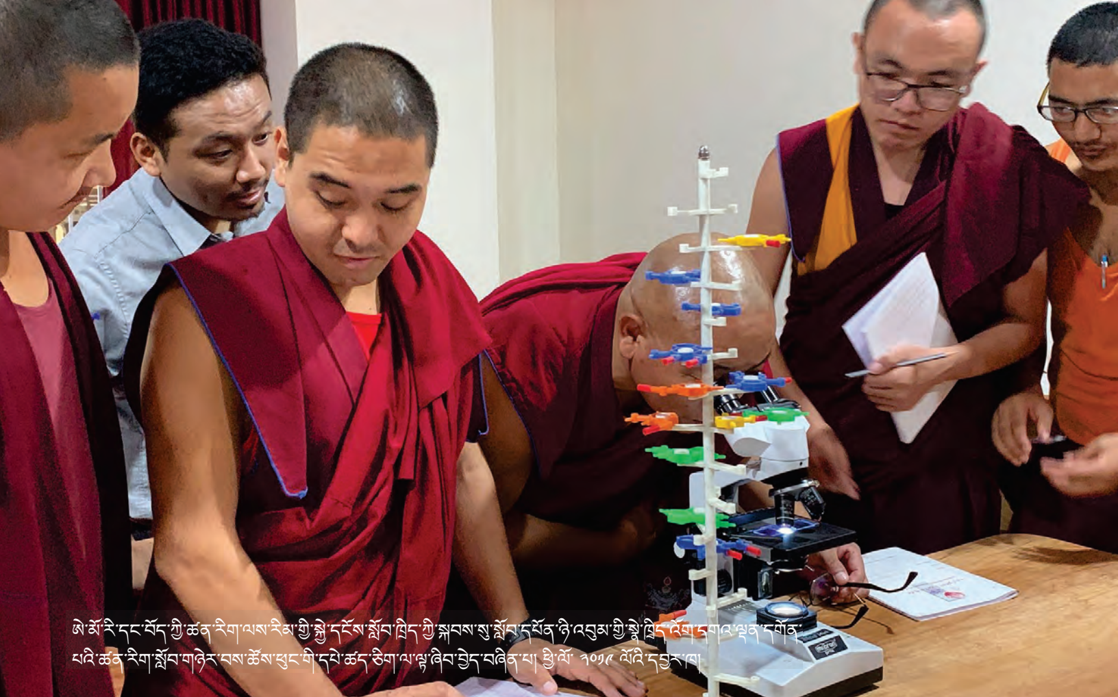
ཨ་མོ་རི་དང་བོད་ཀྱི་ཚན་རིག་ལས་རིམ་གྱི་སྐྱེ་དངོས་སློབ་ཁྲིད་ཀྱི་སྐབས་སུ་སློབ་དཔོན་ཉེ་འབྲམ་གྱི་སྡེ་ཁྲིད་འོག་དགའ་ལྷན་དགོན་ པའི་ཚན་རིག་སློབ་གཉེན་བས་ཚོས་ཕྱང་གི་དཔེ་ཚད་ཅིག་ལ་ལྷ་ཞིབ་བྱེད་བཞིན་པ། ཕྱི་ལོ་ ༢༠༡༩ ལོའི་དབྱར་ཁ།