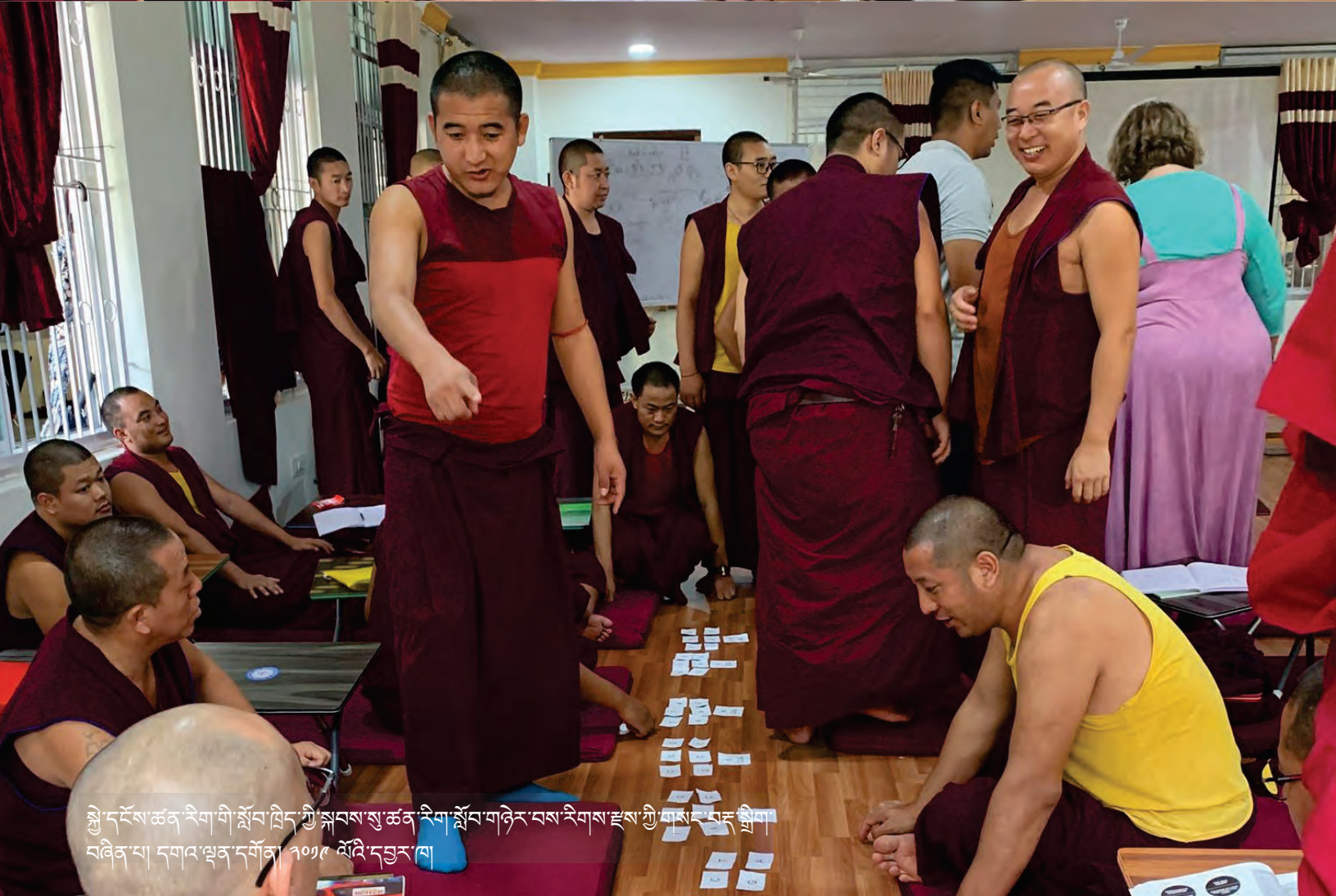
སྐྱེ་དངོས་ཚན་རིག་གི་སློབ་ཁྲིད་ཀྱི་སྐབས་སུ་ཚན་རིག་སློབ་གཉེན་བས་རིགས་ལྔས་ཀྱི་གསུང་བརྗོད་ བཞིན་པ། དགའ་ལྷན་དགོན། ༢༠༡༩ ལོའི་དབྱར་ཁ།